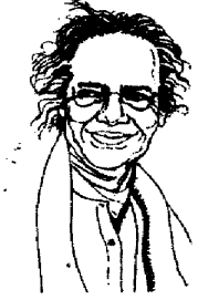
जिणे पलतडचें किरण ताकाच म्हण्टात मरण

हो गोंयचे सुटकेचो काळखंड, लोकशायेचो काळखंड, व्यक्तीस्वातंत्र्य, विचारस्वातंत्र्याचो काळखंड. १९६१ ते ७० मेरेन ते गोंय आकाशवाणीचेर आशिल्ले. १९७० उपरांत तांकां पुराय मेकळीक मेळ्ळी. 'या राजपाशांतून मुक्त होतां' ही ३१ जानेवारी १९६८ ची कविता तांकां फुडें कितें करपाचें आशिल्लें तांचो एक जाहीरनामोच कशी. वैराग्य येतालें ताची सुलूस लागता तांच्या 'मी विझल्यावर' हे कवितेंत. पूण तांणी बरयलां तशें 'विस्मरणाचे थंड काजळी थडगे' आमी गोंयांत जावंक दिवंक ना. सूर्य चंद्र आसासर