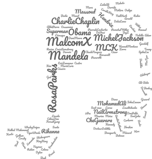
Nuage de Mots – les personnages célèbres

Dans ces quarantaines de chansons, on peut retrouver Céline Dion, la chanteuse canadienne, Pavarotti, le ténor italien parmi les chanteurs américains et anglais comme : Michel Jackson, Hendric, Rihanna, Louis Armstrong, Dylan, John Lennon, Hannah Montana, Jay Z, 2Pac, Rakim, Busta etc. (voir le nuage de mots)