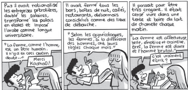
Fig. 6. Riad Sattouf, L'Arabe du futur 1 (2015, 18). © Allary Éditions

Même si les droits des femmes existaient à l'époque de Kadhafi, les femmes ont souffert de manière disproportionnée sous le régime oppressif parce que les femmes libyennes se sacrifient traditionnellement pour leurs familles. On s'attendait à ce que les femmes fassent passer leur mari et leur famille avant elles. Ces conditions sexistes subtiles sont importantes tout au long du roman [Fig.6]. Le monde sexiste libyen façonne les pensées d'Abdel-Razak et il veut donc que sa femme reste à la maison et prenne soin de son fils. « Je veux que ma femme reste à la maison désormais... Et s'occupe de mon fils » (33).