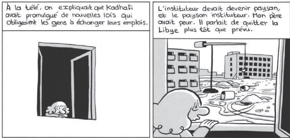
Fig. 7. Riad Sattouf, L'Arabe du futur 1 (2015, 47).

Les citoyens libyens devaient suivre les lois sur la propriété mentionnées dans le livre vert. İkiz (2019) précise que le livre affirme que tout emploi dans le secteur des services en tant que travailleur rémunéré est une nouvelle forme d'esclavage dans le monde moderne. Par conséquent, il y a un fort besoin de justice et de répartition équitable des revenus pour les nécessités. Ainsi, le travail en échange d'un salaire est pratiquement la même chose que l'asservissement d'un être humain. Vers la fin du chapitre 1 du roman L'Arabe du futur 1 , Abdel-Razak apprend que Kadhafi a introduit de nouvelles lois qui obligent la population à échanger ses emplois. « À la télévision, il a été expliqué que Kadhafi avait promulgué de nouvelles lois qui forçaient les gens à échanger leur emploi. » (47). Quelles que soient la profession et les compétences, les emplois doivent être échangés [Fig. 7]. Par conséquent, fervent partisan du panarabisme et de ses politiques, Abdel-Razak est pris dans un dilemme. Le monde qu'il soutient finit par se retourner contre ses intérêts. Ainsi, il décide de rentrer en France.