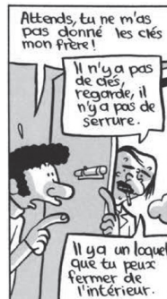
Fig. 4. Riad Sattouf, L'Arabe du futur 1 (2015, 11). © Allary Éditions