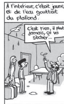
Fig. 5. Riad Sattouf, L'Arabe du futur 1 (2015, 11).

La Libye de Kadhafi était régie par les lois énoncées dans son « livre vert ». Le livre vert était l’un des éléments fondamentaux de son idéologie qui nous aide à comprendre son régime socialiste à partir de la réalité socio-économique et politique (Ikiz, 2019). Dans le roman, l’image et le panneau ont le pouvoir de contribuer à l’histoire avec des éléments tels