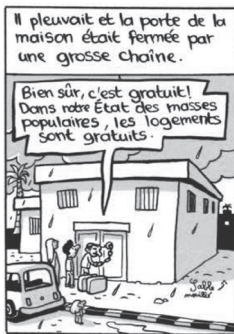
Fig. 3. Riad Sattouf, L'Arabe du futur 1 (2015, 11). © Allary Éditions

La loi sur l’abolition de la propriété privée des maisons a fourni aux citoyens des maisons gratuites dont les portes ont été fermées par d’énormes chaînes. [fig. 3]. Les portes n’avaient pas de serrures puisque les maisons n’appartenaient à aucune personne en particulier. [fig. 4]. L’abolition de la propriété a conduit à ne pas tenir compte de la maison que l’on occupait. Les maisons étaient délabrées et aucune personne ne considérait qu’il était de son devoir de s’en occuper [Fig. 5].