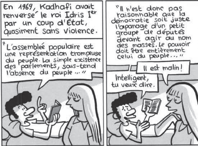
Fig. 1. Riad Sattouf, L'Arabe du futur 1 (2015, 18). © Allary Éditions

Dans le monde de l'État des masses populaires libyennes, les politiques socialistes radicales du gouvernement libyen n'ont pas réussi à créer une économie de soutien pour ses citoyens. Avec la privatisation économique et le contrôle des marchés, la société s'est retrouvée avec des pénuries alimentaires. Cette incapacité de l'État à assurer la distribution de nourriture est notée par Vandewalle (1991).